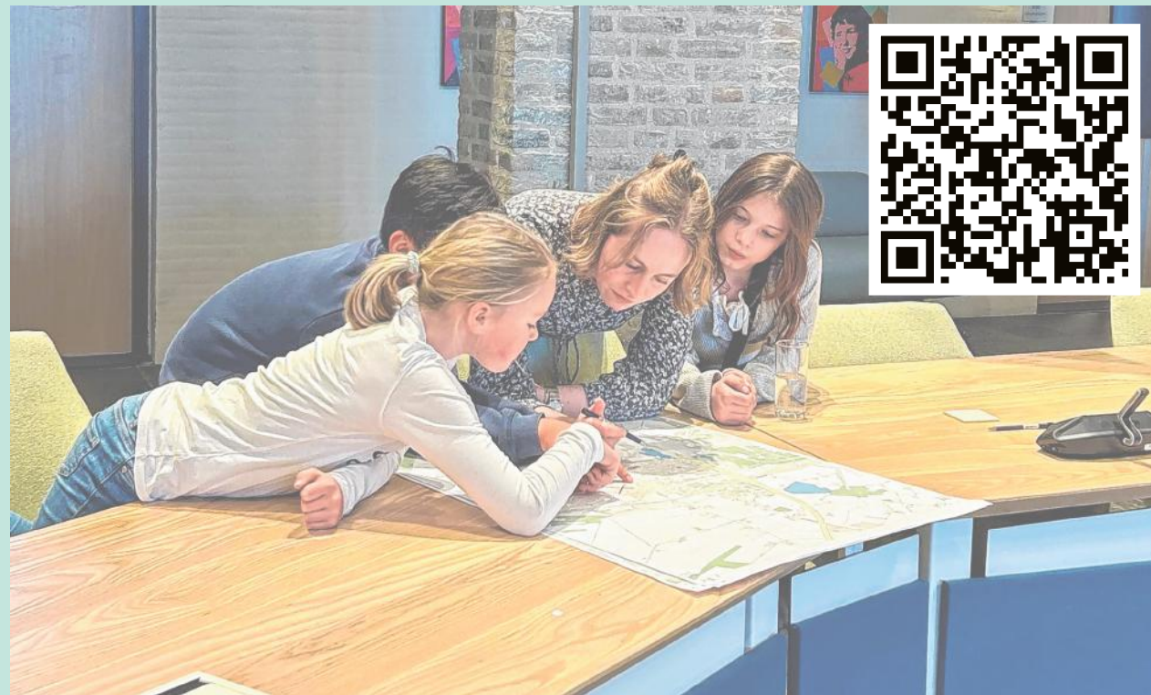
De jeugdgemeenteraad dacht op 25 februari mee over de toekomst van Gilze en Rijen.